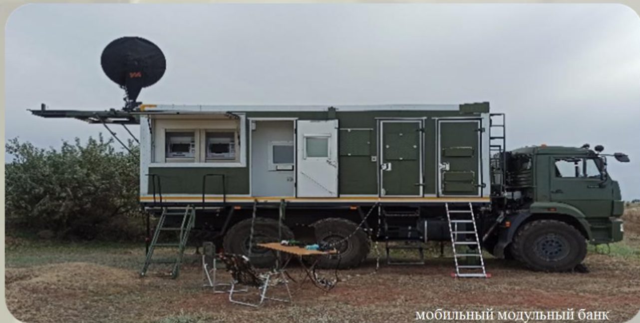
мобильный модульный банк