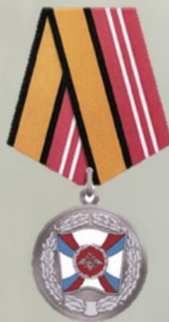
МЕДАЛЬ "ЗА УКРЕПЛЕНИЕ БОЕВОГО СОДРУЖЕСТВА"