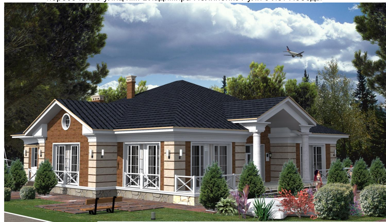
Видовой кадр на главный фасад по ул. им. Владимира Пелипенко

пересечение улиц им. Владимира Пелипенко / ул.70 лет Победы