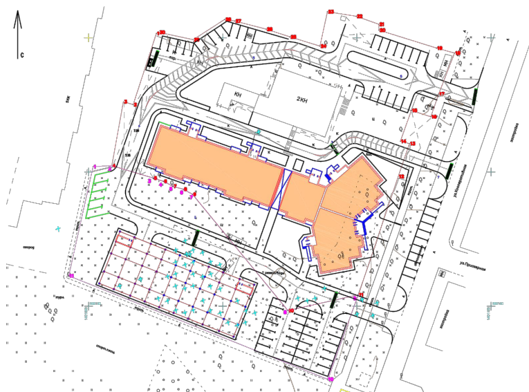
Схема планировочной организации