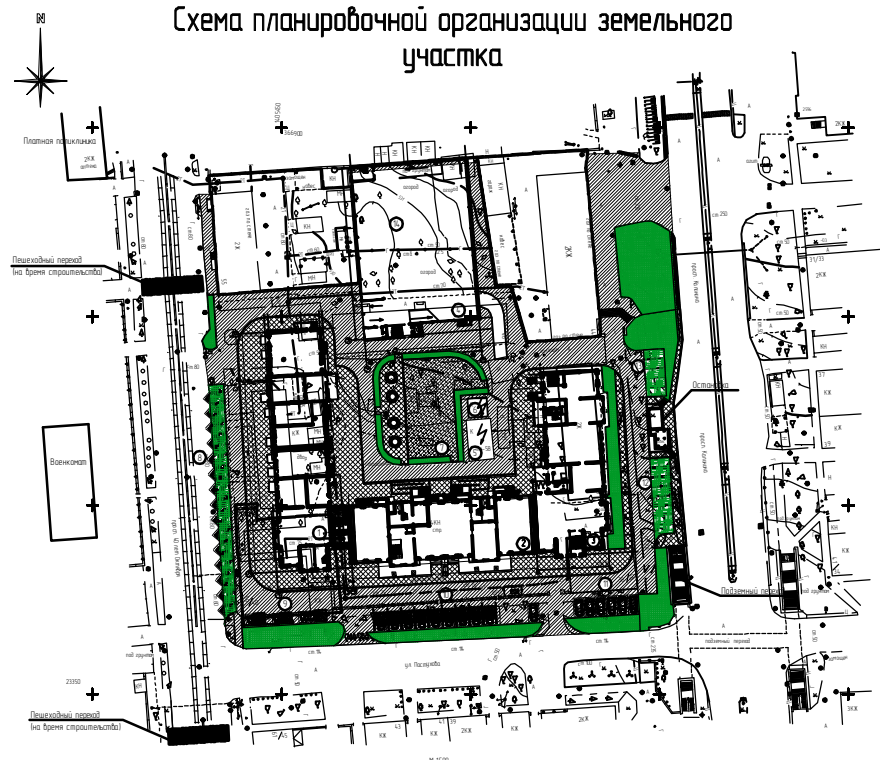
Схема планировочной организации земельного участка