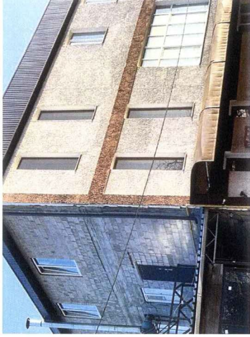
Фасад с ул. Калинина