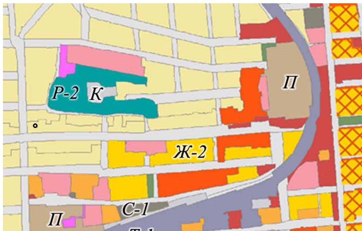
Фрагмент карты градостроительного зонирования территории муниципального образования города-курорта Пятигорск