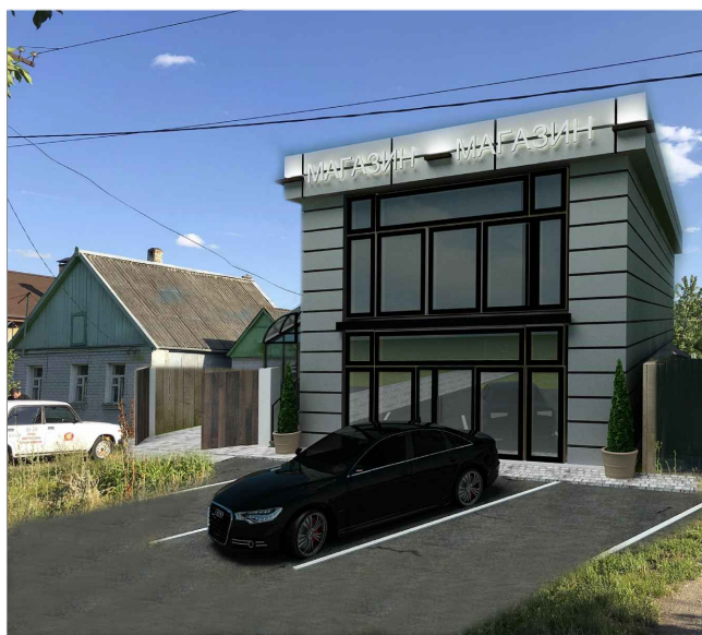
Фасад со стороны ул. Ермолова

ОСНОВНЫЕ ТЕХНИКО-ЭКОНОМИЧЕСКИЕ ПОКАЗАТЕЛИ