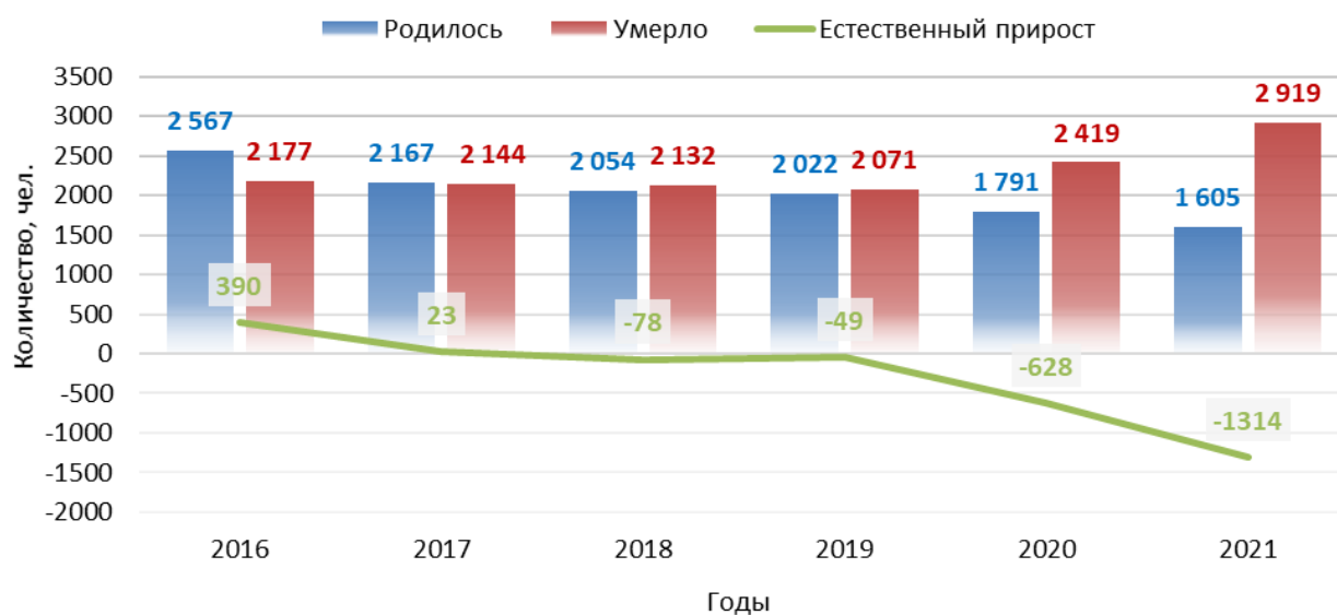
Рисунок 1. Динамика естественного прироста населения города-курорта Пятигорска

Общая численность родившихся в муниципальном образовании городе-курорте Пятигорске за период с 2016 по 2021 г. составило 12205 чел., а умерших – 13862 чел., тем самым в результате естественных процессов численность населения муниципального образования сократилась на 1657 чел.